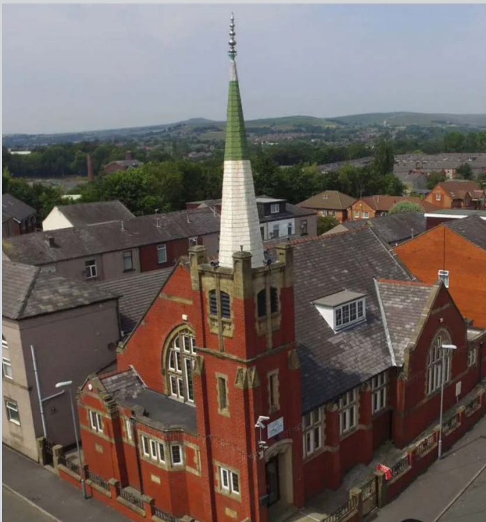
Vroeger een kerk, nu een moskee...

Hoewel sociaal-wenselijk antwoorden bij mensen van alle achtergronden speelt, merken we het vooral bij de mensen uit Afrikaanse of Aziatische culturen. Rochdale is een multiculturele stad. Het is ook een multireligieuze stad zoals dat deftig heet. Er is niet maar één godsdienst dominant. Dat kan je wel zien aan de nieuwe minaretten en koepels van de grote moskeeën die naast de oude kerktorens de skyline bepalen. De meer dan 20 moskeeën groeien als kool, terwijl veel kerken krimpen of moeten sluiten. Onlangs werd bekend dat een moskee in het centrum van Rochdale toestemming krijgt voor een vervanging van het oude gebouw. De oude voldeed niet meer en was te klein.